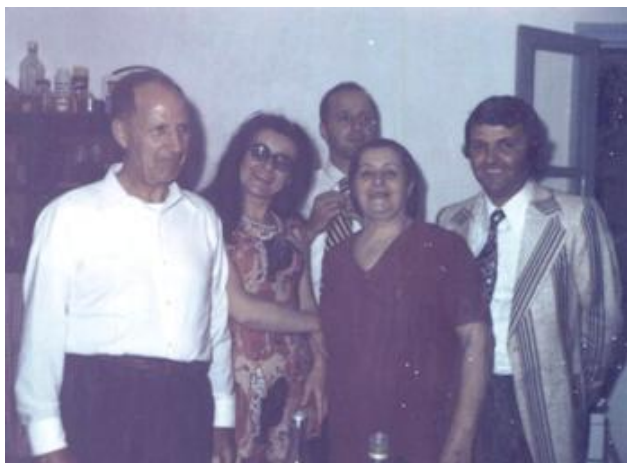
La famille réunie en 1974,