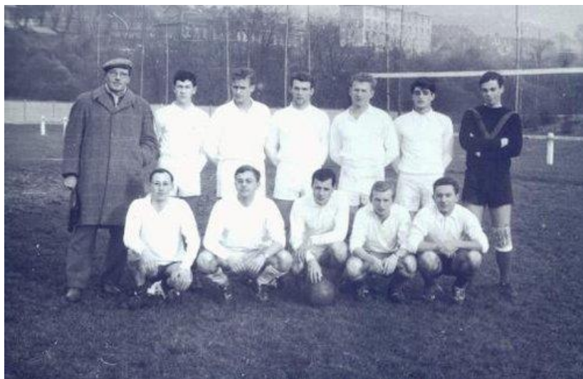
Le foot à Rouen Je me suis débrouillé pour tenir le ballon

J'ai déjà raconté la prépa. L'école d'ingénieurs est du même tonneau. Je m'y ennue terriblement. Heureusement, il y a le foot et les copains. L'an dernier, j'ai revu deux d'entre eux, dont l'unique fille de la promo. J'ai essayé de m'excuser pour cette époque où j'avais l'impression que l'on n'entendait que moi, mais non, ils trouvaient que j'avais été supportable et que j'étais sévère avec moi-même. Le seul reproche de ma copine, avec qui j'étais en travaux pratiques, c'est que je la laissais faire le boulot toute seule. Les braves gens !